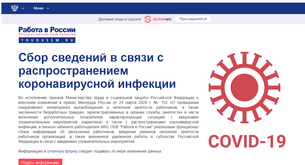
Рис. 2. Информационная страница